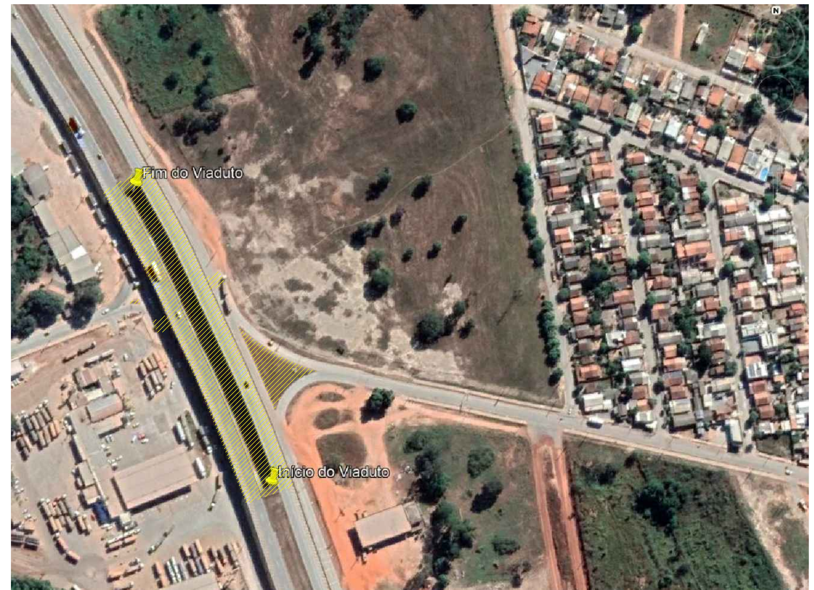
27 Localização Viaduto- Imagem Google Earth Esc: Sem Escala