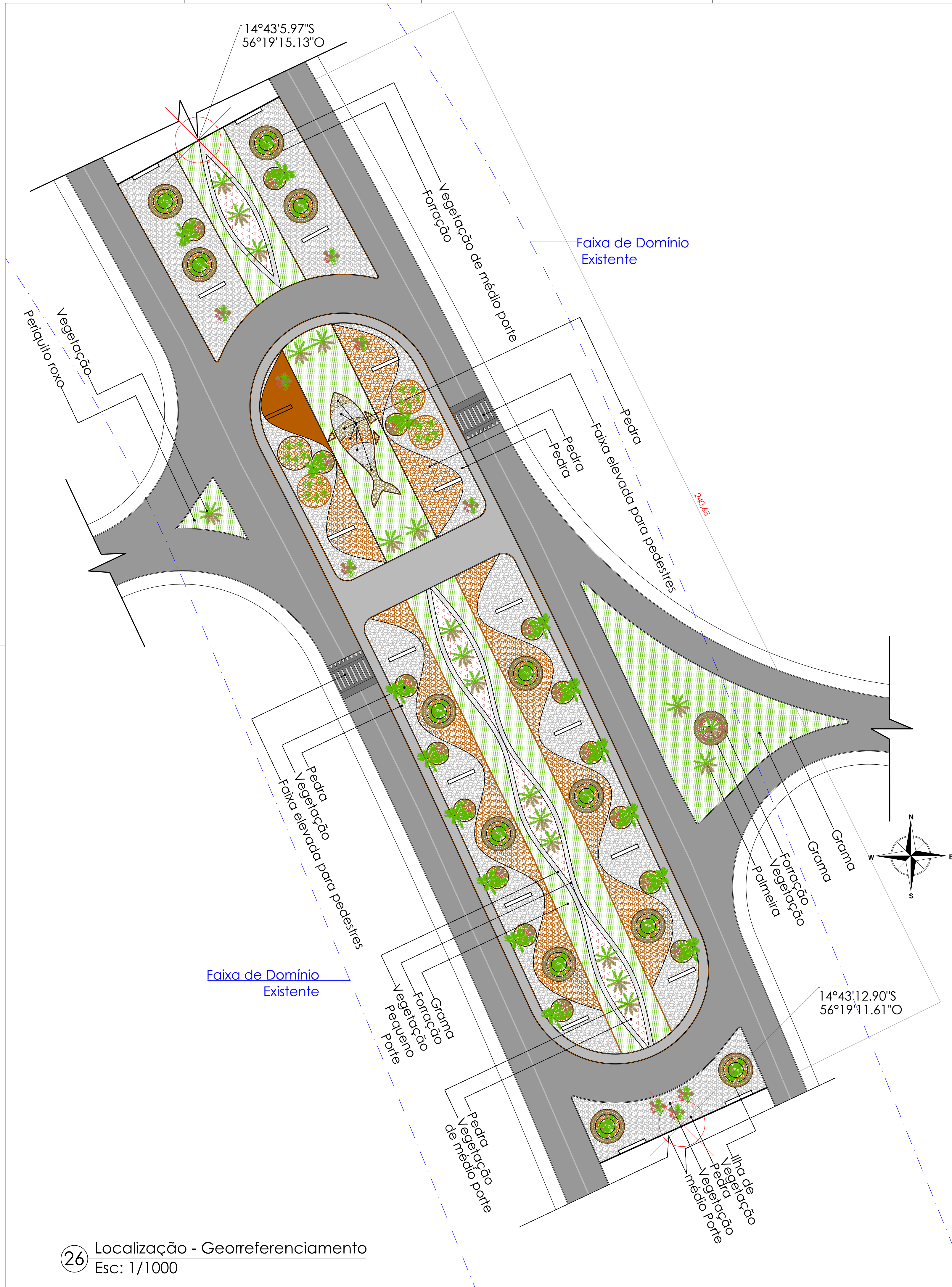
26 Localização - Georreferenciamento Esc: 1/1000